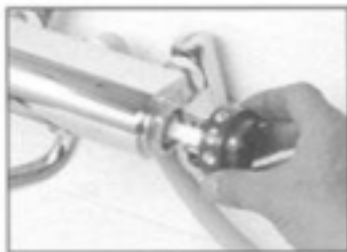
4. 切替表示リングをはずしてください。