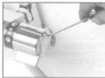
2. 切替ハンドルの切り欠け部に精密ドライバー(－)等でハンドルキャップをはずしてください。