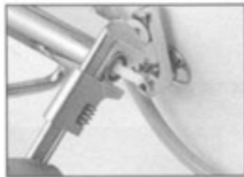
5. カートリッジ押えをスパナ等で左に回してください。