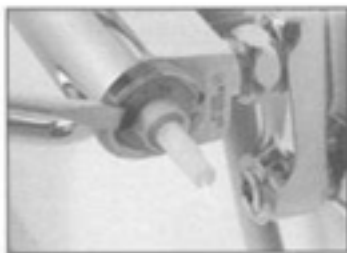
6. カートリッジ押えをはずしてください。切替カートリッジの軸溝にドライバー(－)をあてて押し上げてください。