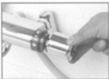
3. 切替ハンドルをひき抜いてください。