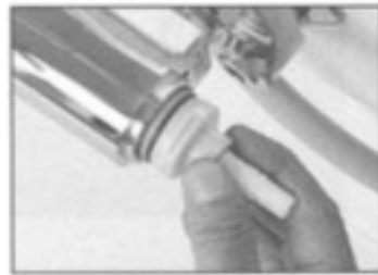
8. 切替カートリッジの凸部を水栓本体の凹部にあわせて収め「カチッ」と音がすることを確認してください。