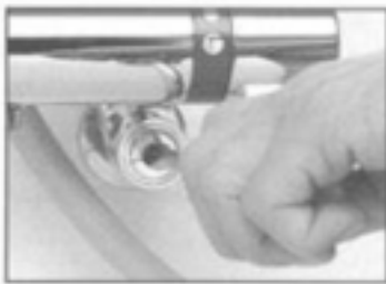
1. 切替ハンドルをカラン側に回して吐水状態にします。取付ソケット部の流量調節ねじ(内ねじ)をドライバー(－)で右にいっぱいまで回して締め込み、湯・水を止めてください。

※主に『切替ハンドルを止め位置にしても止水できない』などの症状時に交換する部材ですが不具合原因が本部品以外に起因する場合は改善効果が現れないことも考えられます。予めご了承ください。