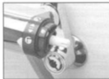
10. 切替カートリッジの栓棒先端の位置決め面(凹部)が手前水平にしてください。