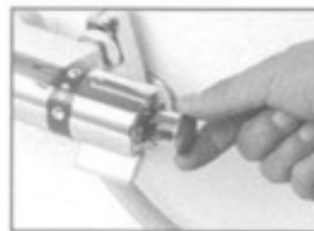
※切替ハンドルはキャップで固定する方式になっております。